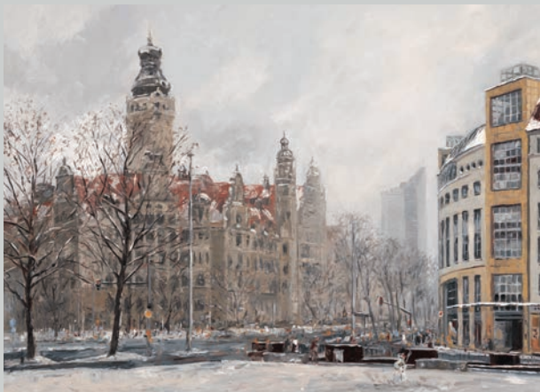
Matschwetter am Neuen Rathaus