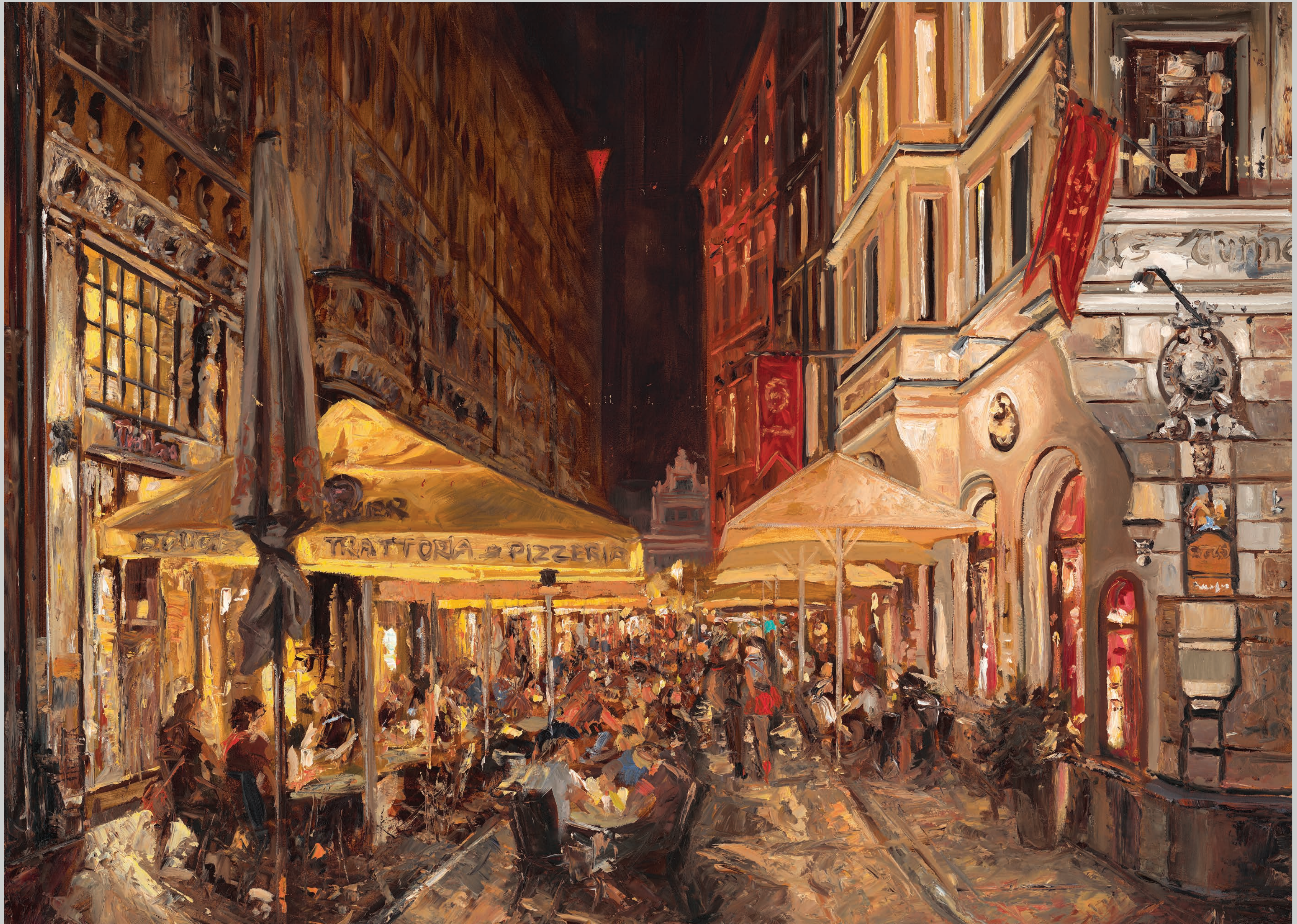
Schaulaufen im roten Röckchen • 2022 • Öl auf MDF-Platte • 65 x 80 cm