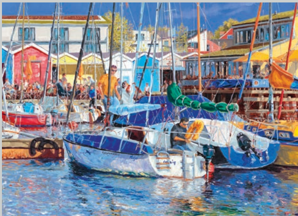
Sommer am Pier 1