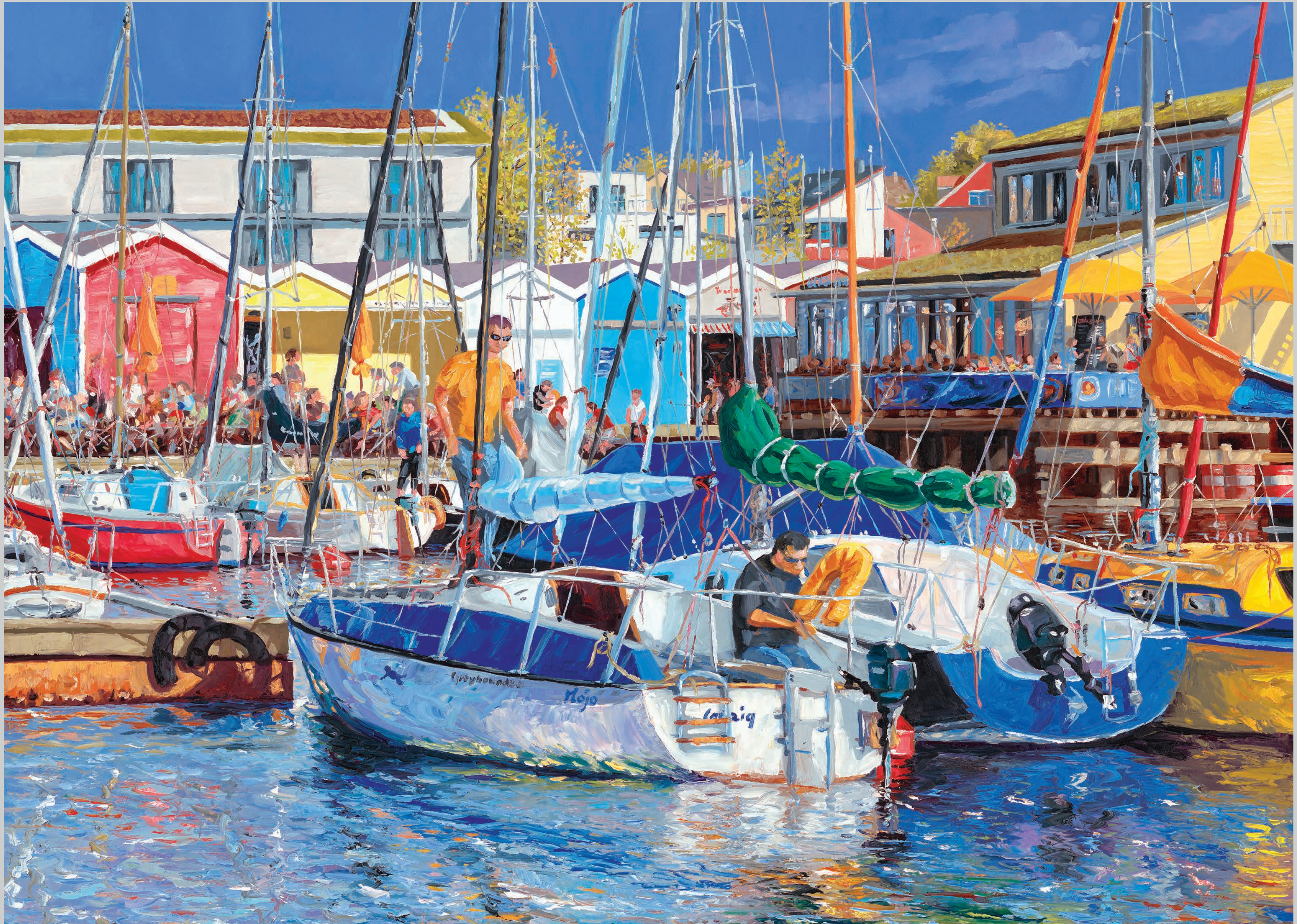
Sommer am Pier 1 • 2023 • Öl auf MDF-Platte • 60 x 80 cm