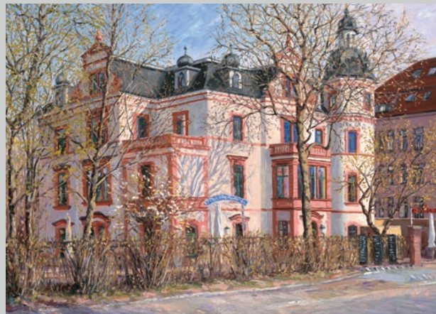
Mückenschlösschen in Leipzig