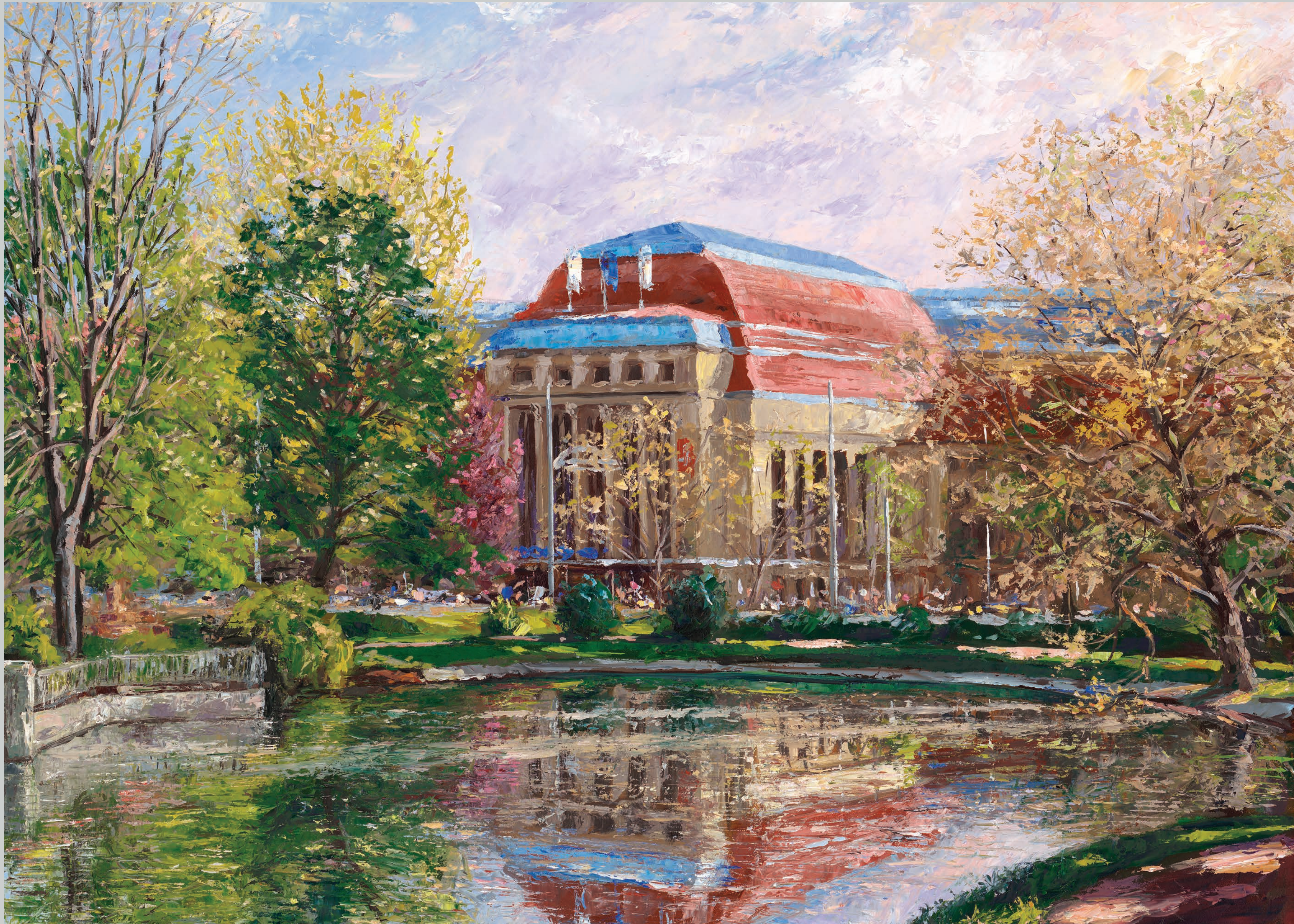
Schwanenteich am Hauptbahnhof • 2023 • Öl auf MDF-Platte • 55 x 70 cm