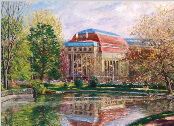
Schwanenteich am Hauptbahnhof