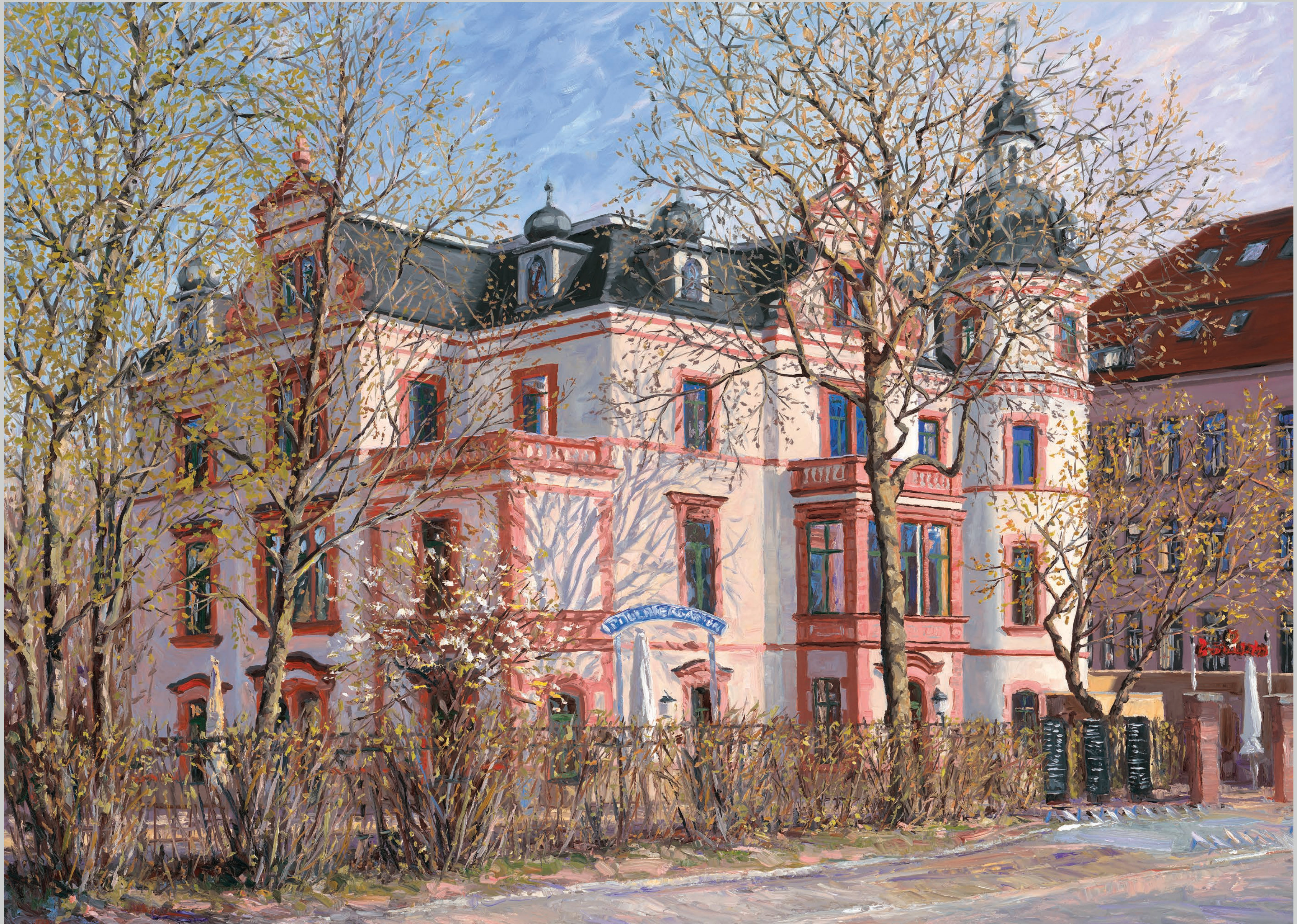
Mückenschlösschen in Leipzig • 2023 • Öl auf MDF-Platte • 65 x 80 cm