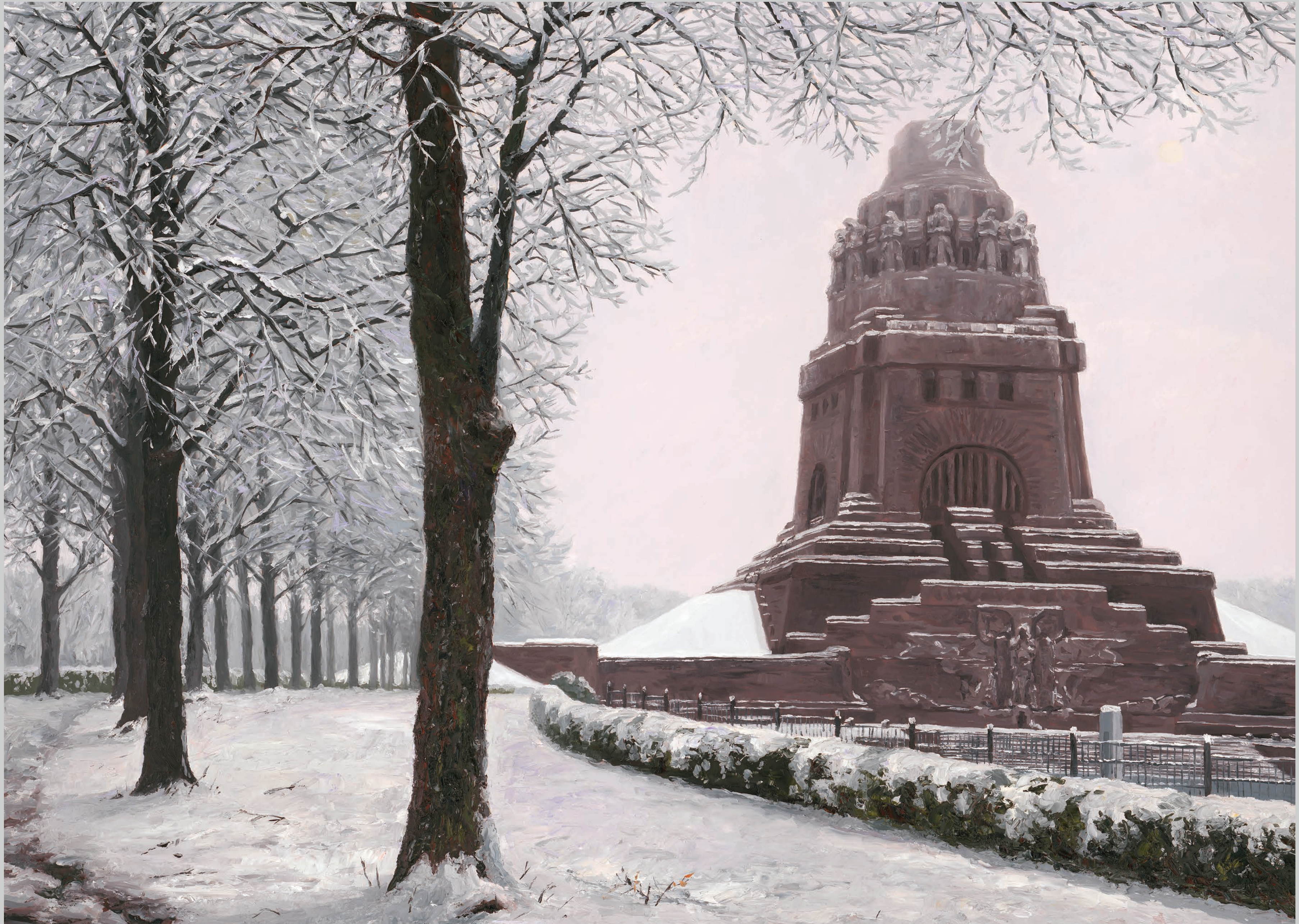
Schneegriesel am Völkerschlachtdenkmal • 2023 • Öl auf MDF-Platte • 65 x 80 cm