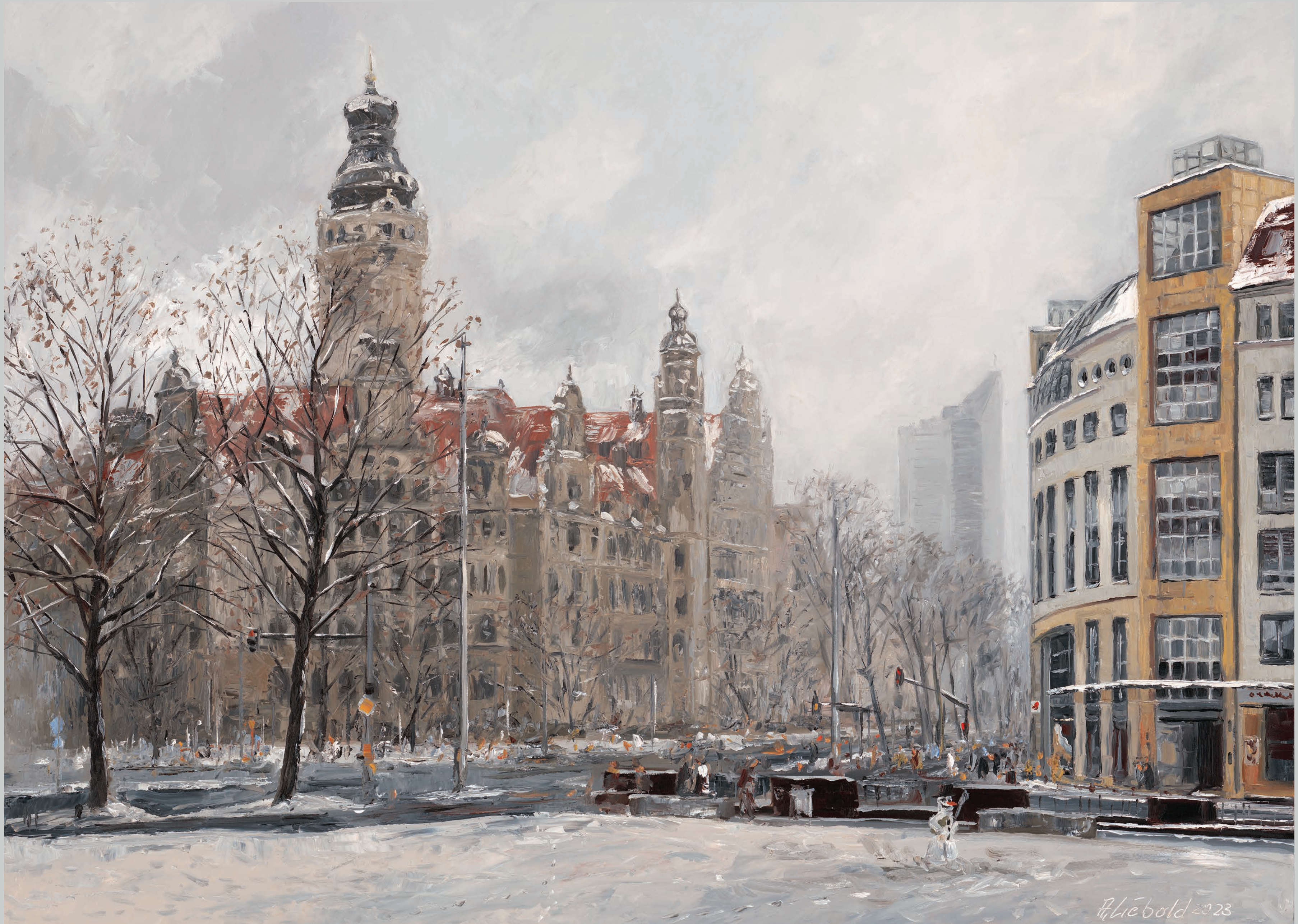
Matschwetter am Neuen Rathaus • 2023 • Öl auf MDF-Platte • 60 x 80 cm