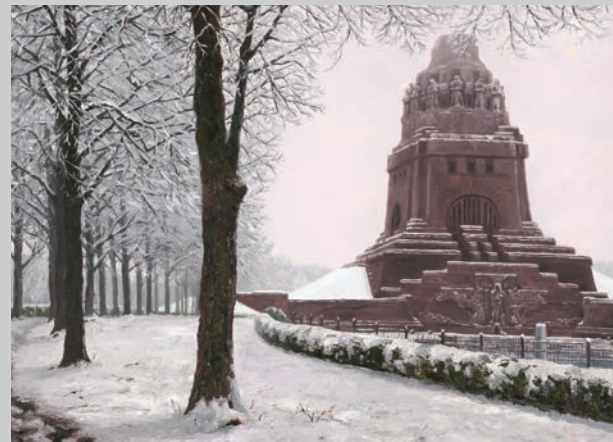
Schneegriesel am Völkerschlachtdenkmal