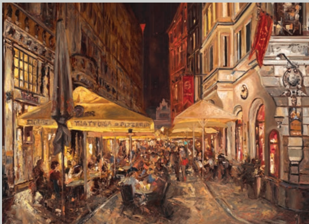
Schaulaufen im roten Röckchen