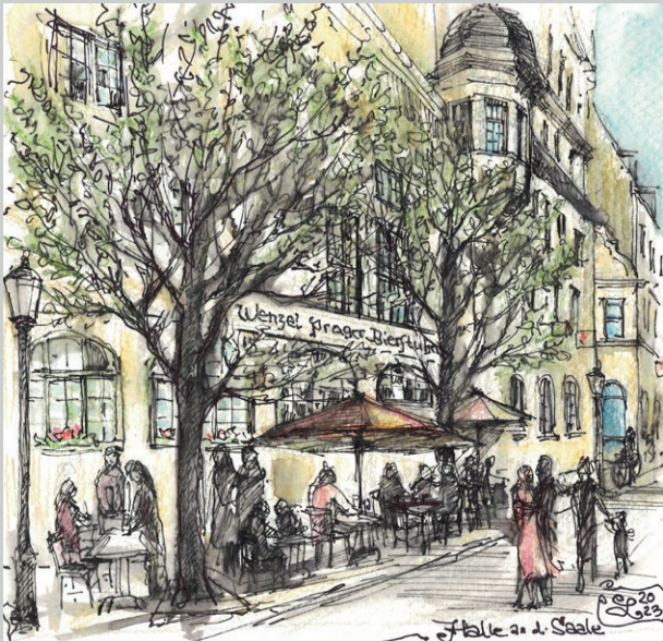
Wenzels Prager Bierstuben