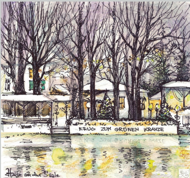
Krug zum Grünen Kranze