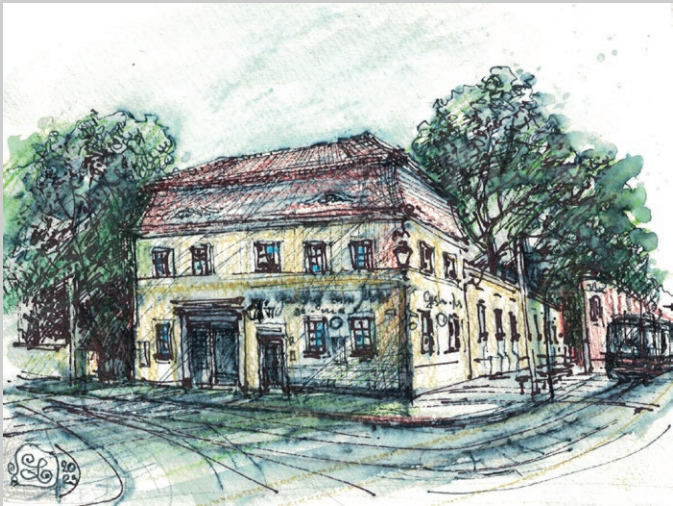
Gasthof „Zum Mohr“