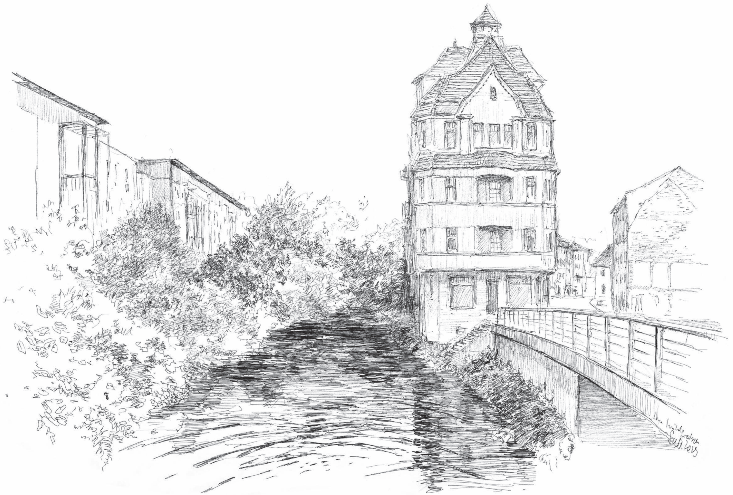
Am Mühlgraben • Volker Seifert • Tuschezeichnung • 2023 • 30 x 42 cm