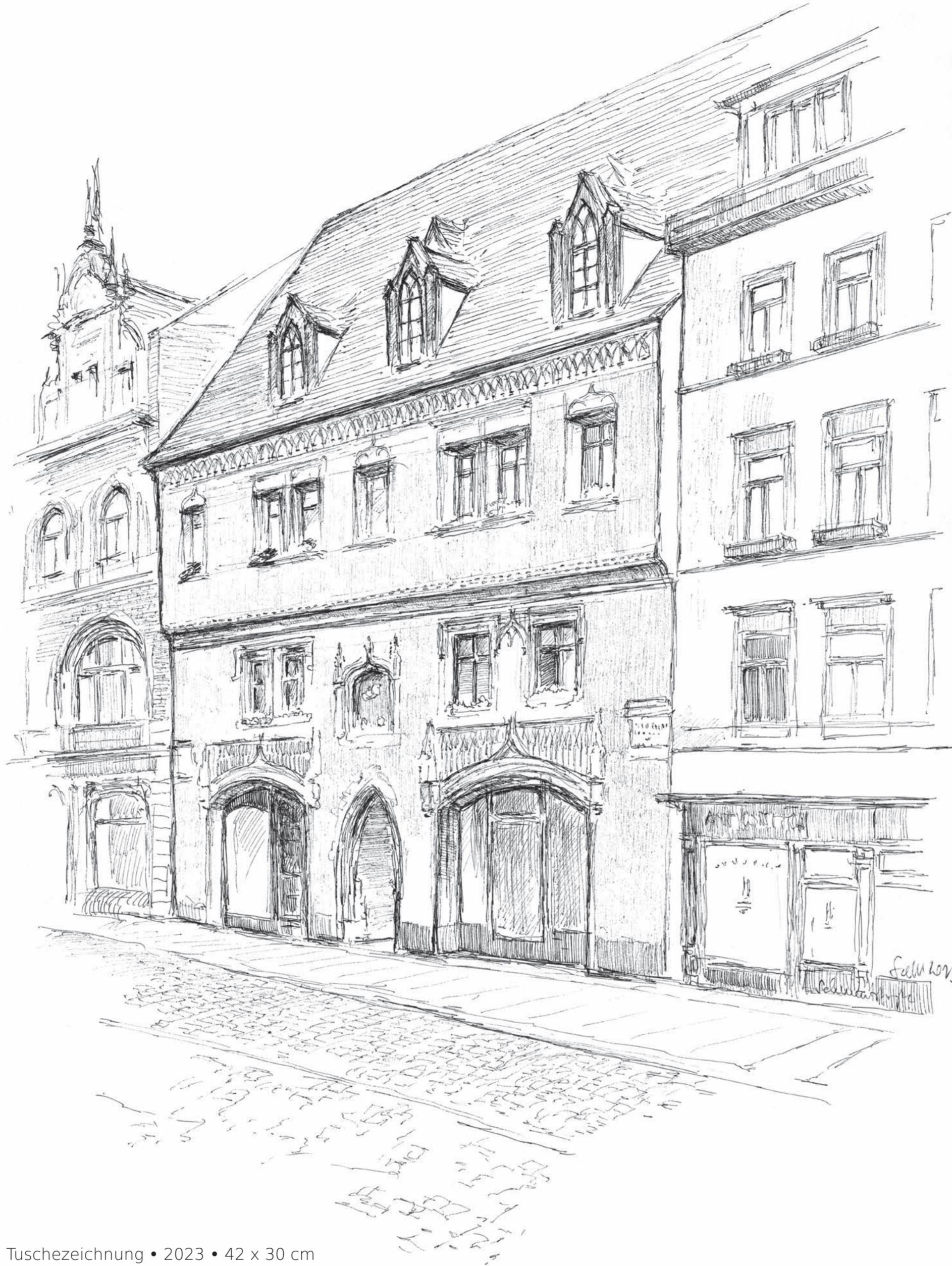
Schmeerstraße • Volker Seifert • Tuschezeichnung • 2023 • 42 x 30 cm