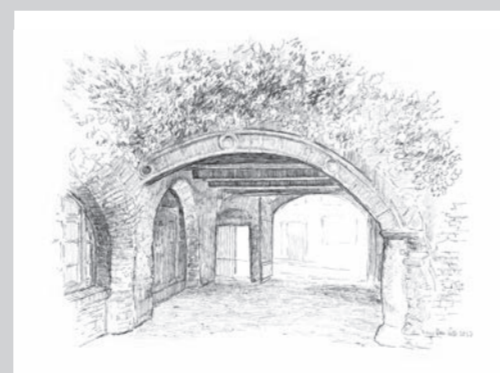
Neuer Bau (Domstr. 5)