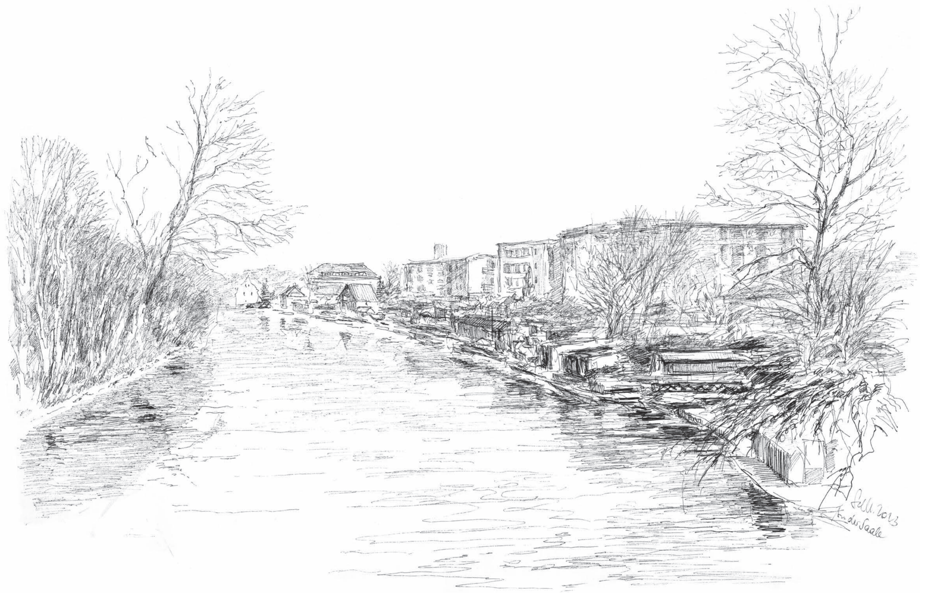
An der Saale • Volker Seifert • Tuschezeichnung • 2023 • 30 x 42 cm