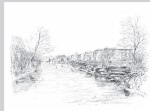
An der Saale