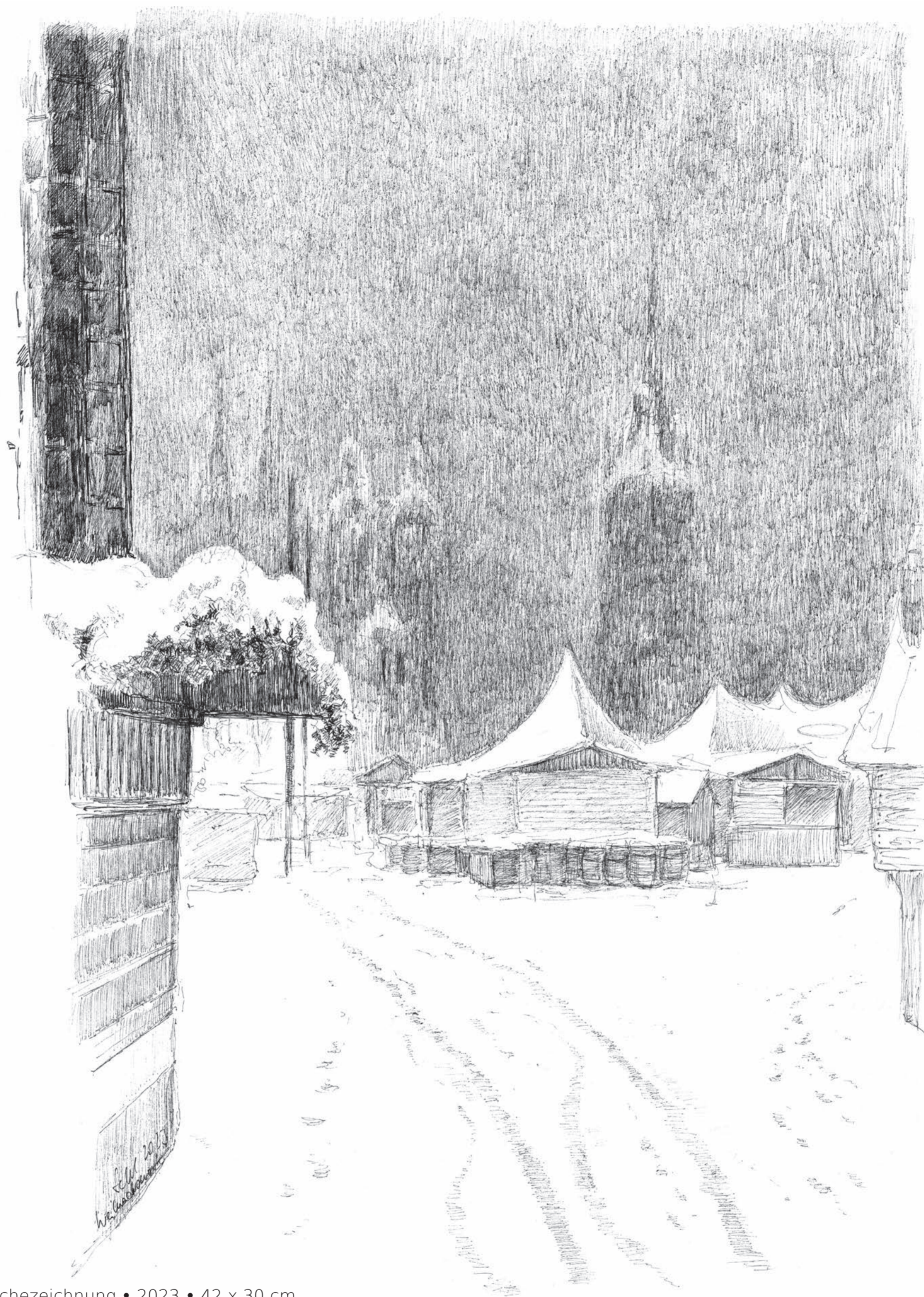
Weihnachtsmarkt • Volker Seifert • Tuschezeichnung • 2023 • 42 x 30 cm