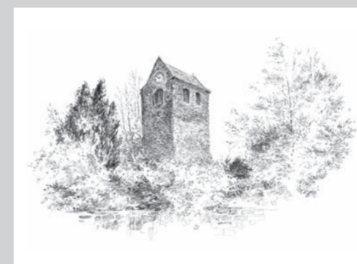
St. Briccius Kirche