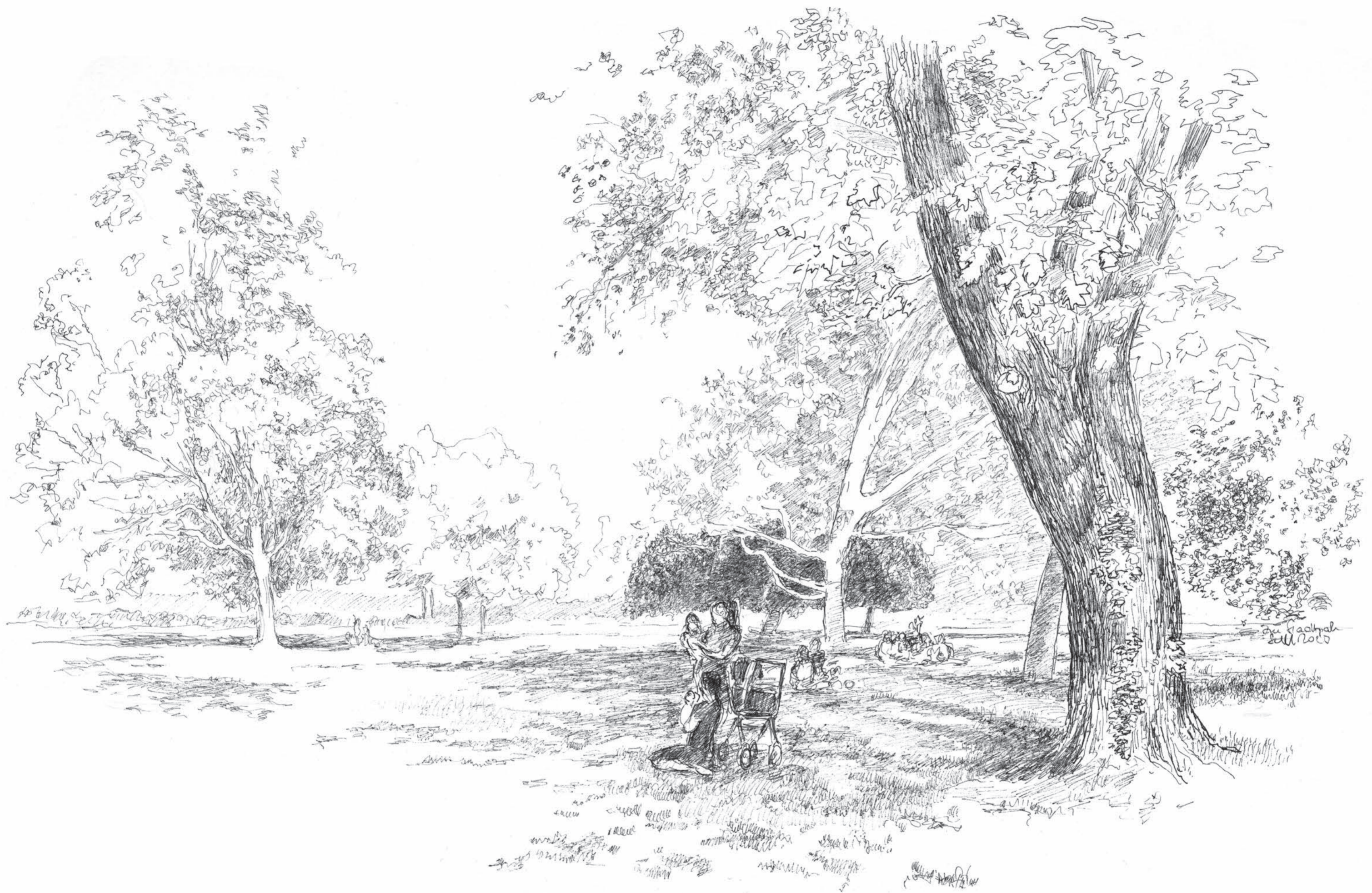
Im Stadtpark • Volker Seifert • Tuschezeichnung • 2023 • 30 x 42 cm