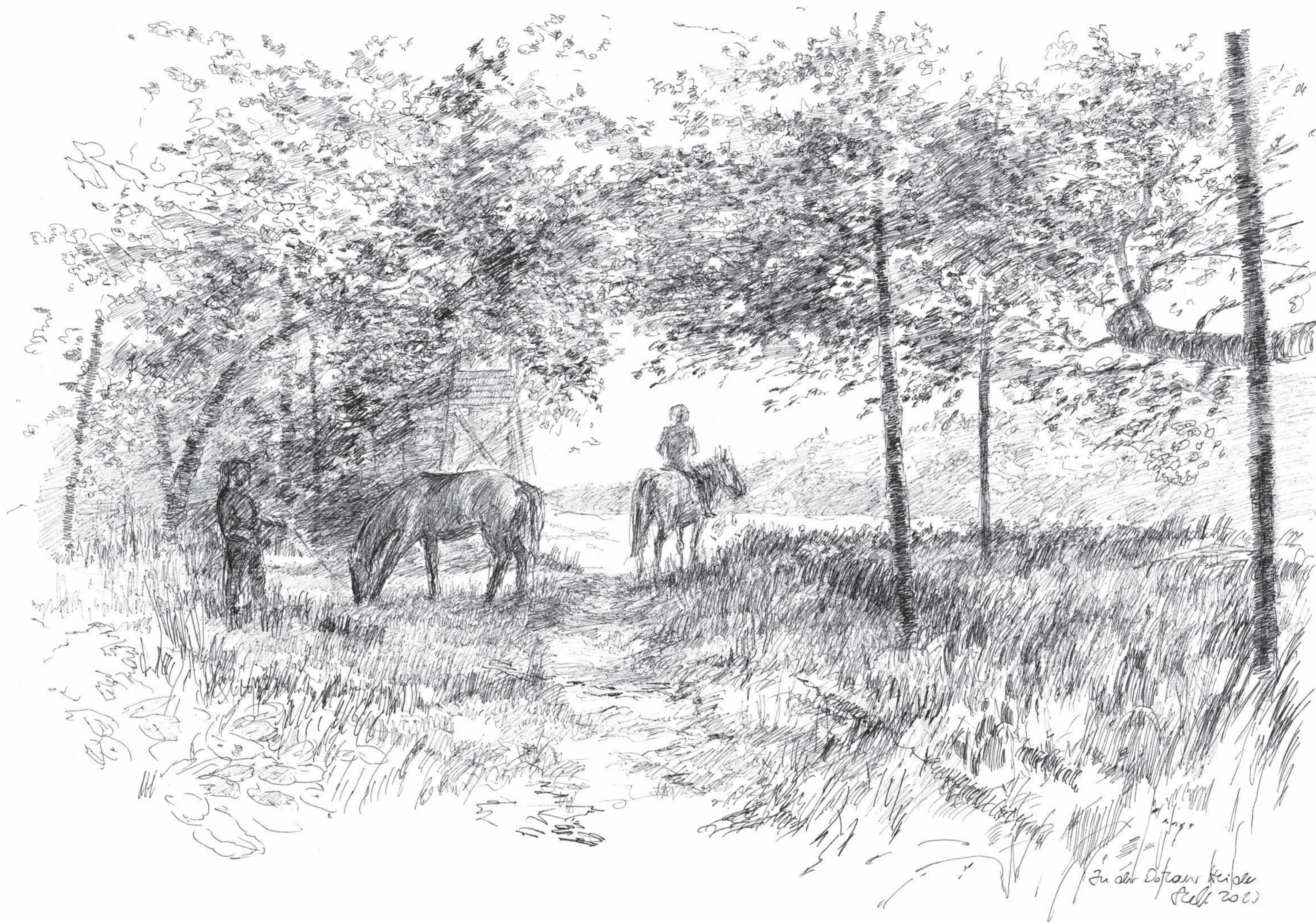
In der Dölauer Heide • Volker Seifert • Tuschezeichnung • 2023 • 30 x 42 cm