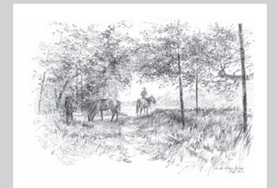
In der Dölauer Heide