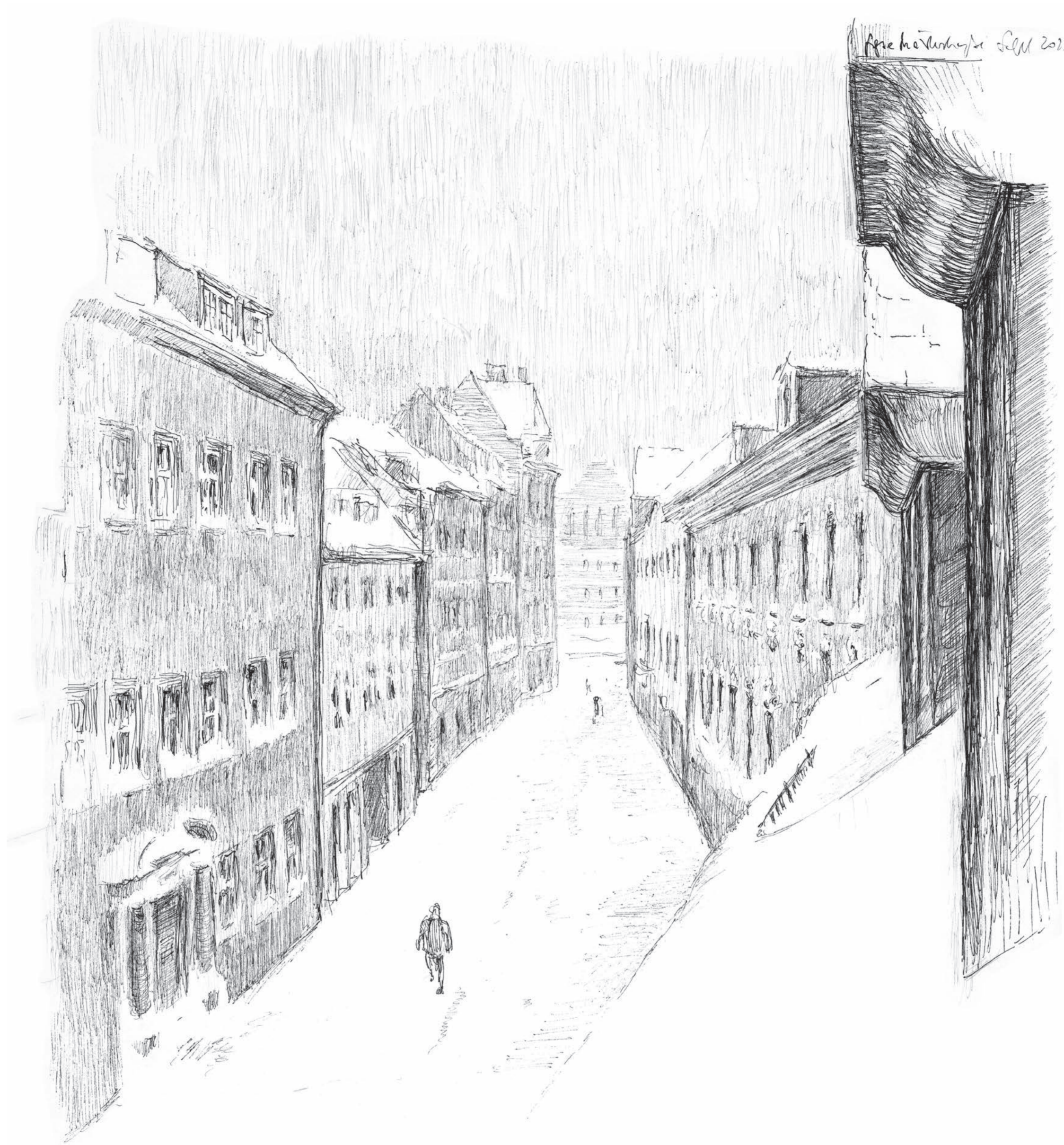
Große Märkerstraße • Volker Seifert • Tuschezeichnung • 2023 • 42 x 30 cm