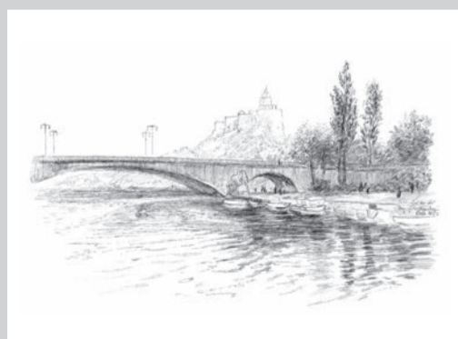
Saaleufer an der Burg Giebichenstein