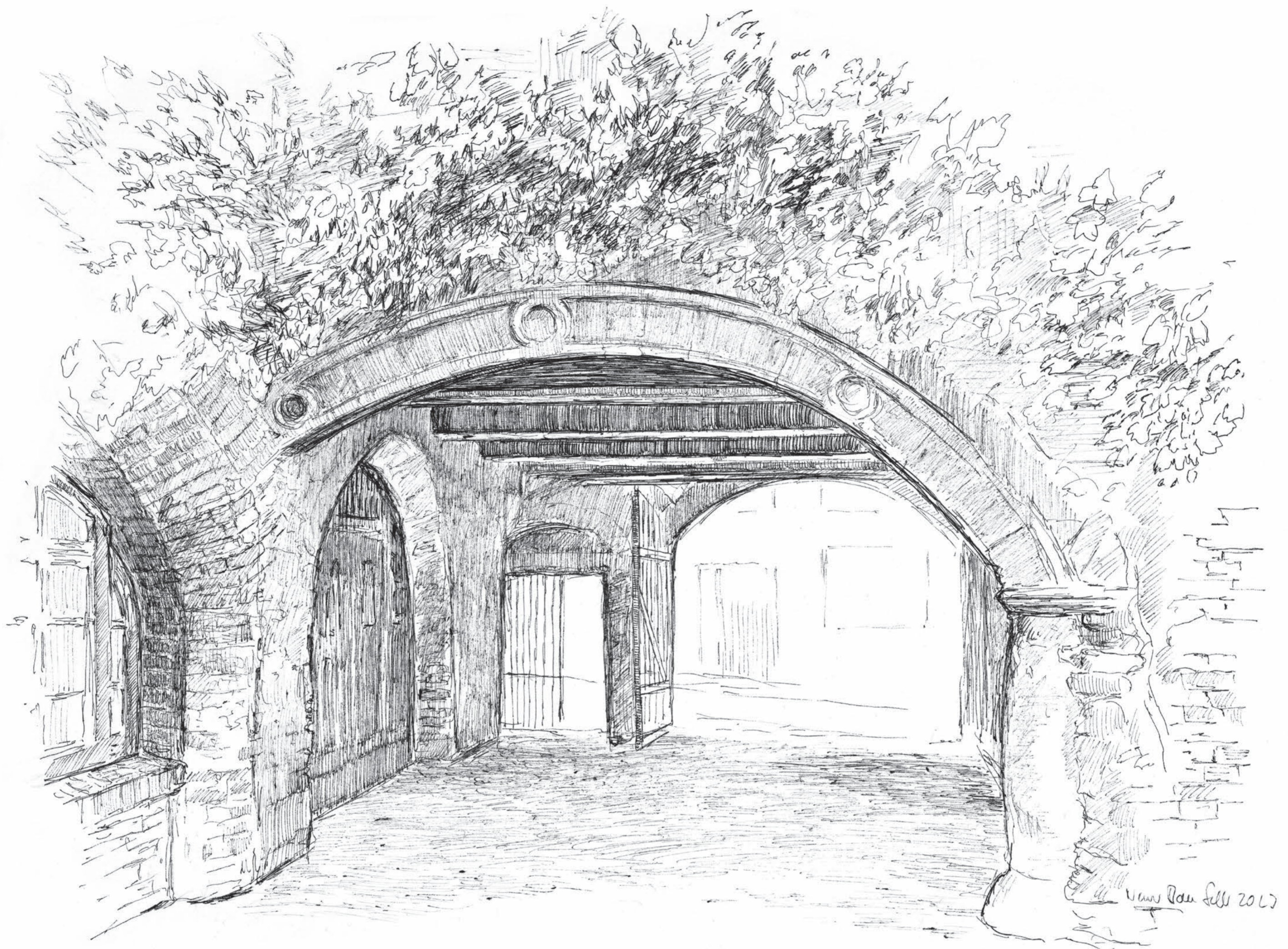
Neuer Bau (Domstraße 5) • Volker Seifert • Tuschezeichnung • 2023 • 30 x 42 cm