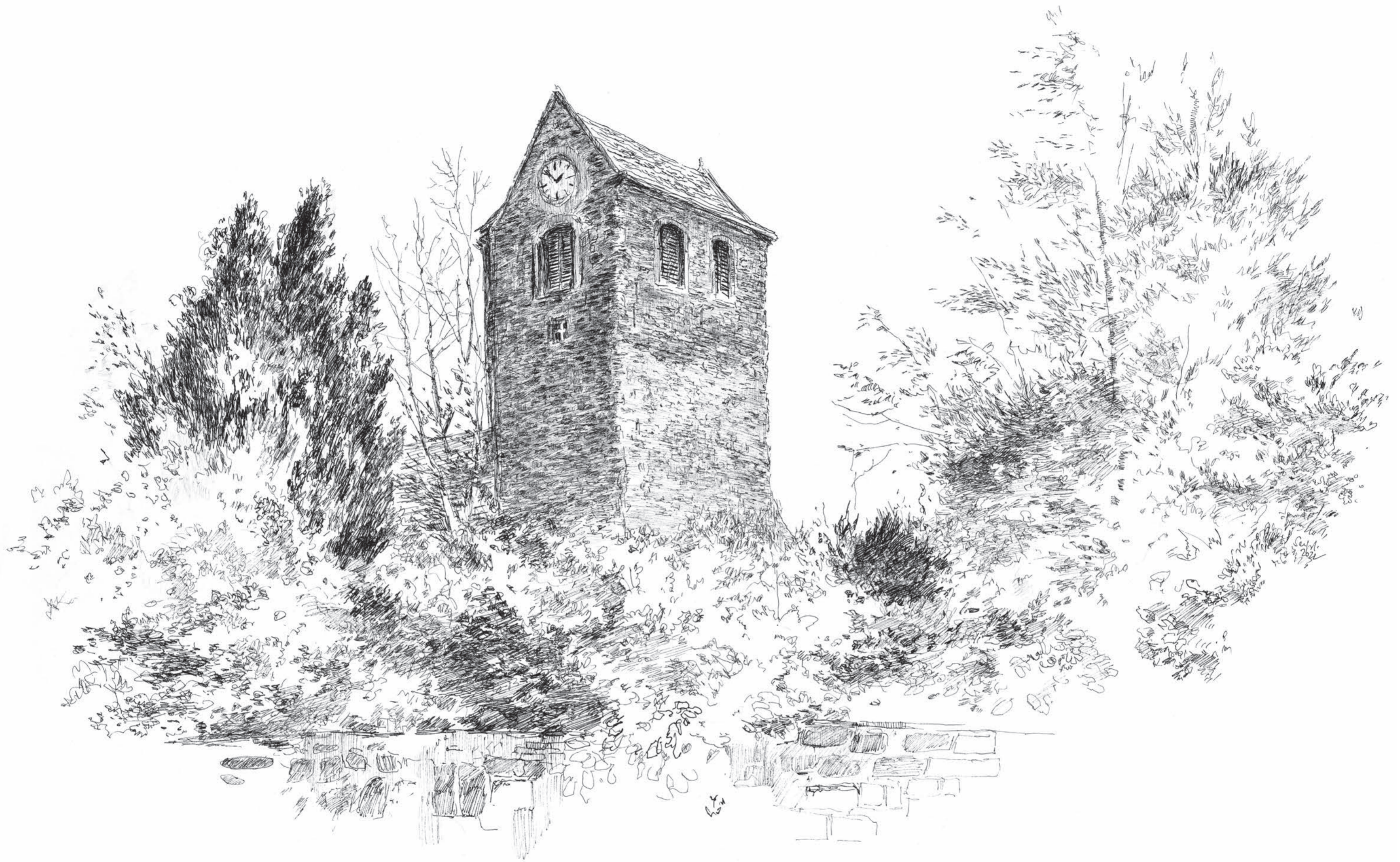
St. Briccius Kirche • Volker Seifert • Tuschezeichnung • 2022 • 40 x 60 cm