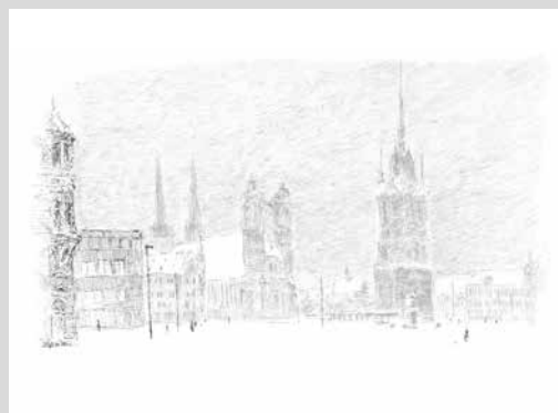
Hallescher Markt im Winter

HINWEIS: Besuchen Sie unsere Kunstmesse für zeitgenössische Landschaftsmalerei aus Mitteldeutschland vom 27. September bis zum 13. Oktober 2024 in der Willi-Sitte-Galerie in Merseburg.