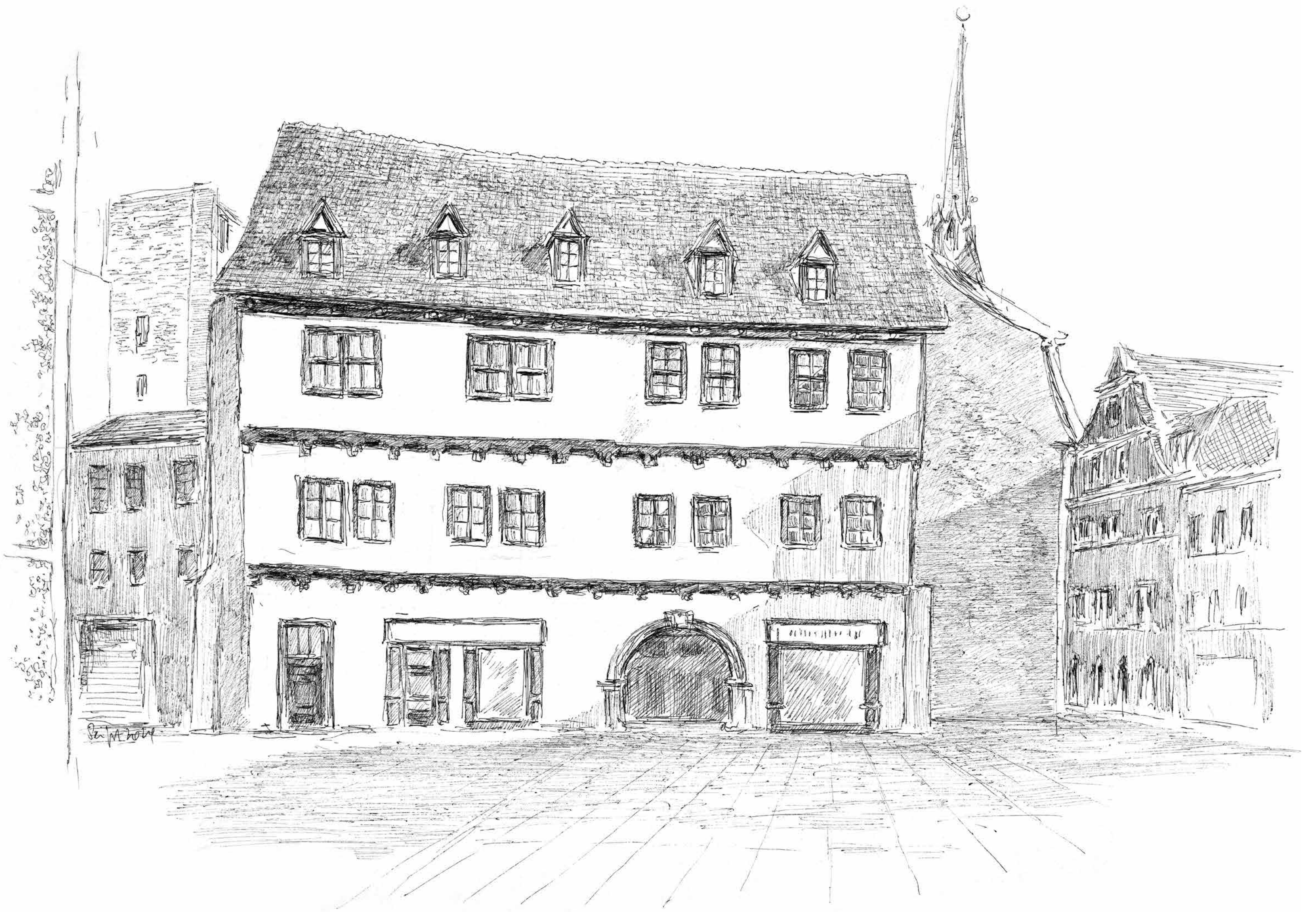
Kleine Klausstraße • Tuschezeichnung • 2024 • 30 x 42 cm • Volker Seifert