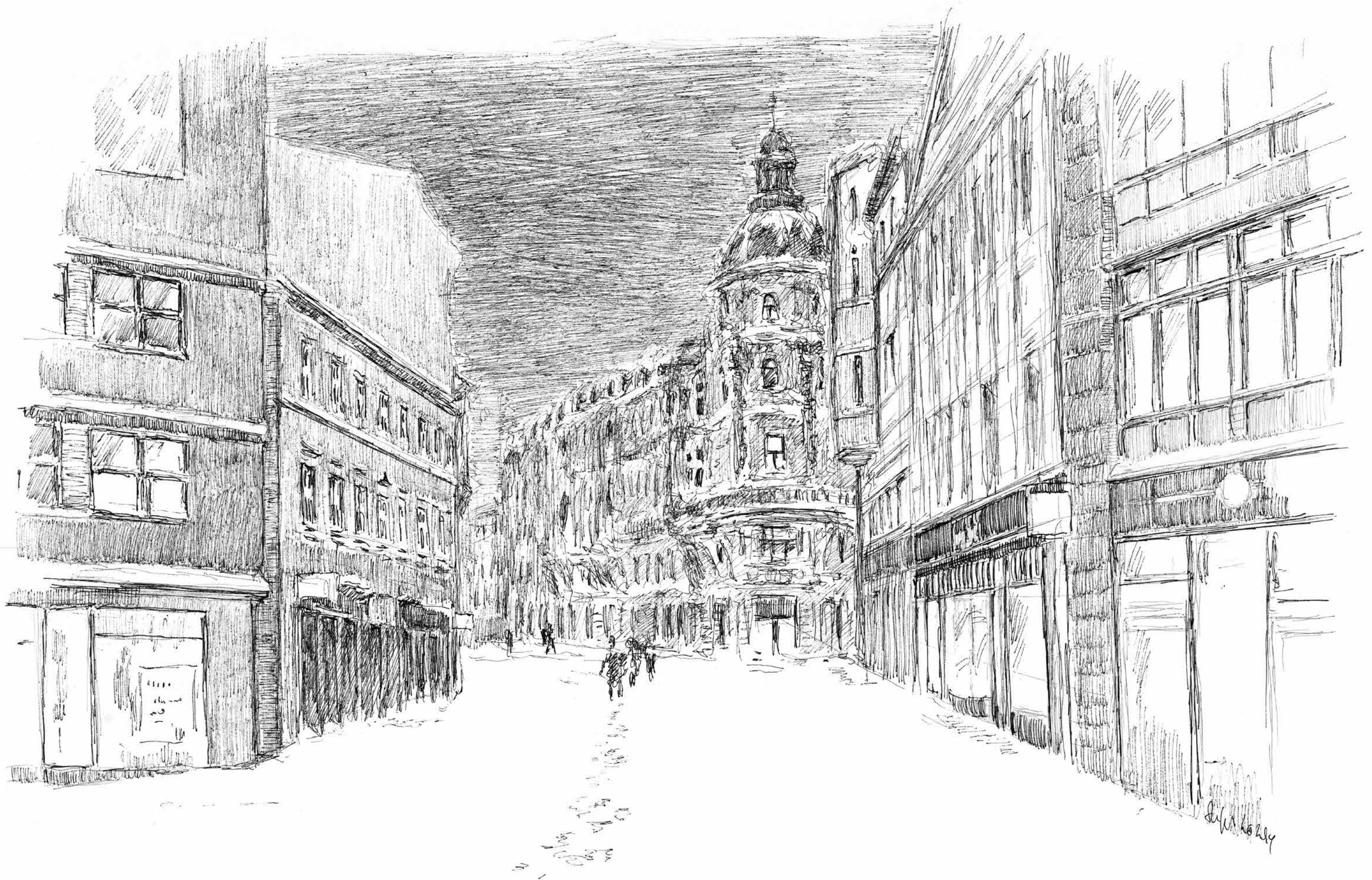
Leipziger Straße • Tuschezeichnung • 2024 • 30 x 42 cm • Volker Seifert