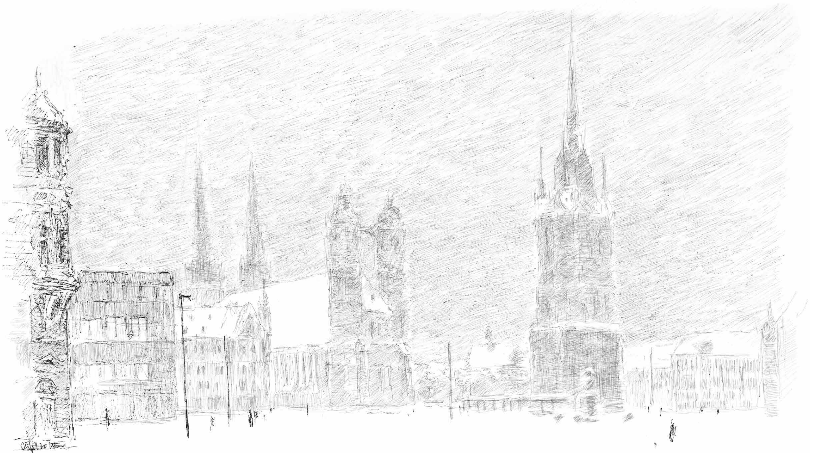
Hallescher Markt im Winter • Tuschezeichnung • 2024 • 30 x 42 cm • Volker Seifert