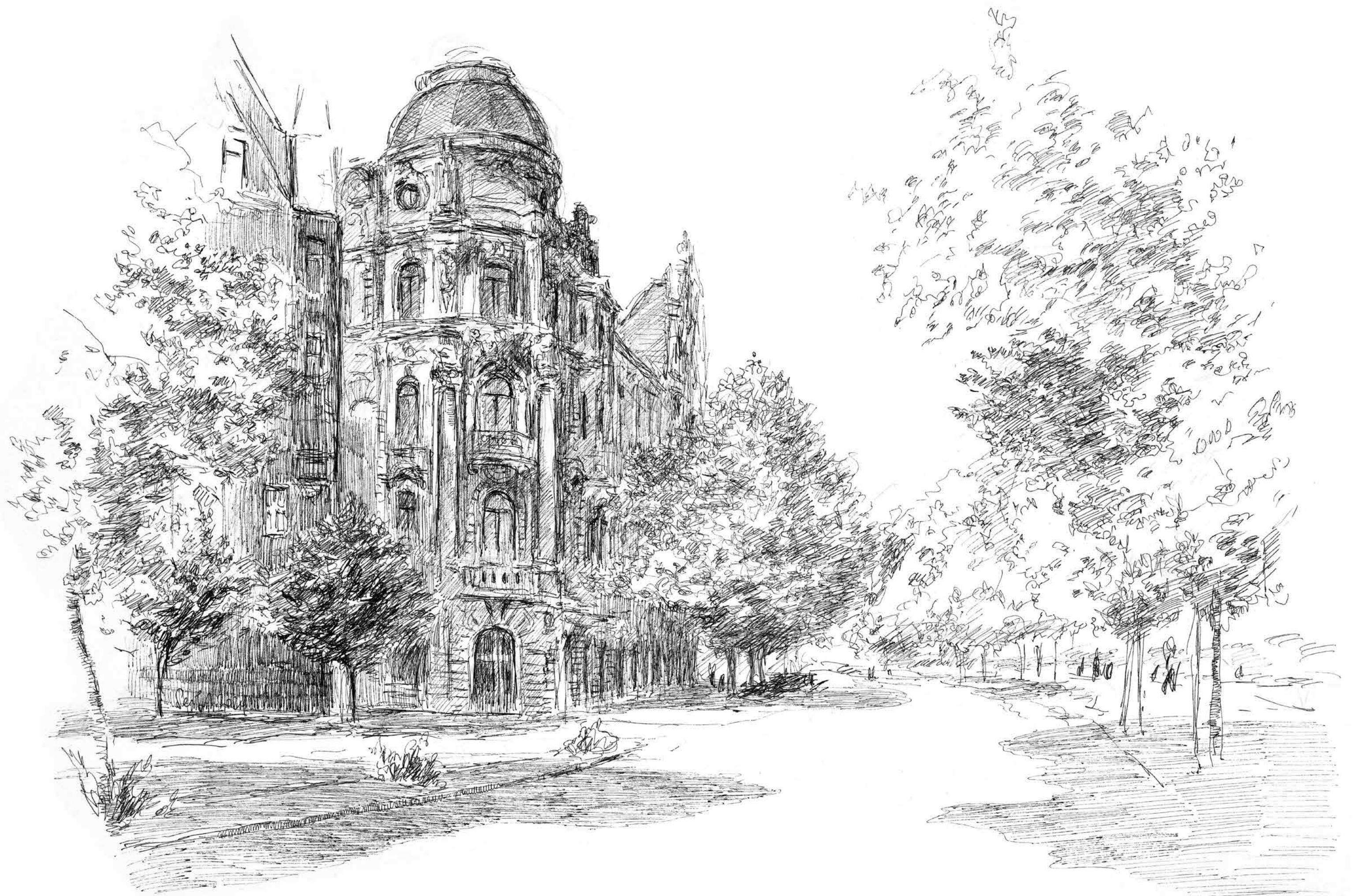
Universitätsring • Tuschezeichnung • 2024 • 30 x 42 cm • Volker Seifert