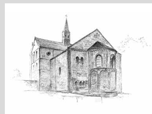
Die Stiftskirche Petersberg