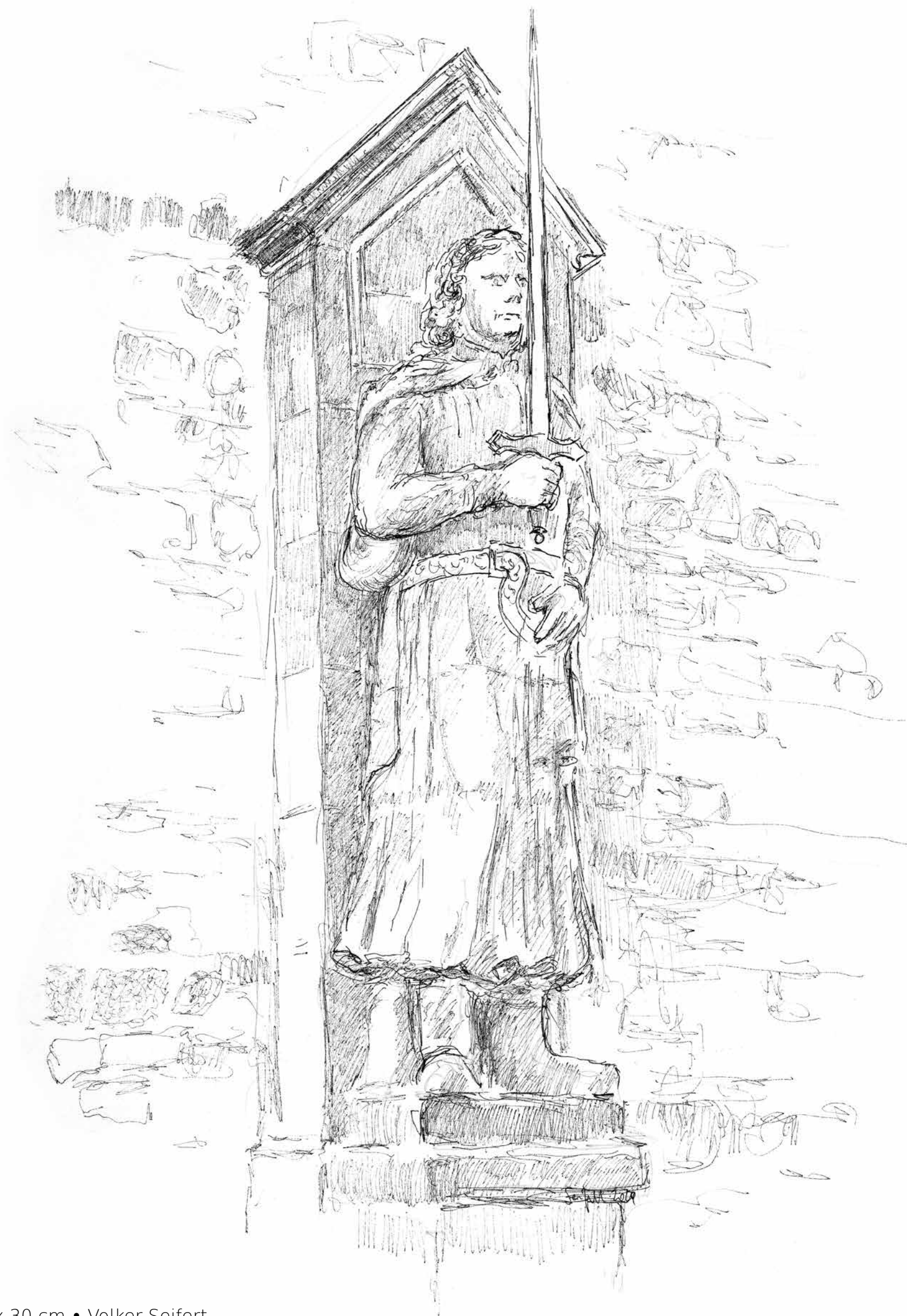
Der Roland • Tuschezeichnung • 2024 • 42 x 30 cm • Volker Seifert