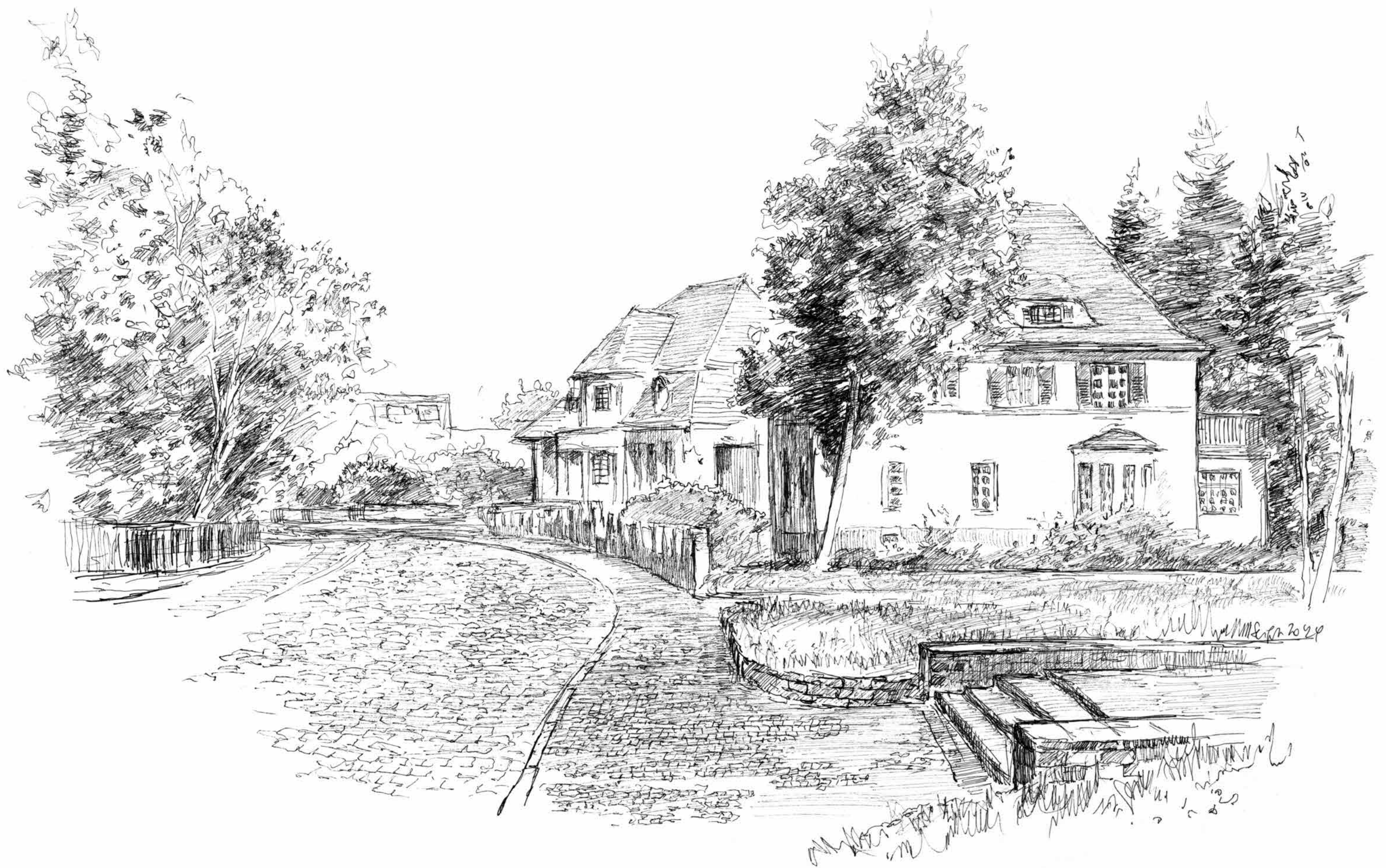
Hoher Weg • Tuschezeichnung • 2024 • 30 x 42 cm • Volker Seifert