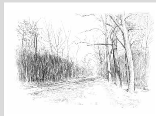
Kolkturnweg in der Dölauer Heide