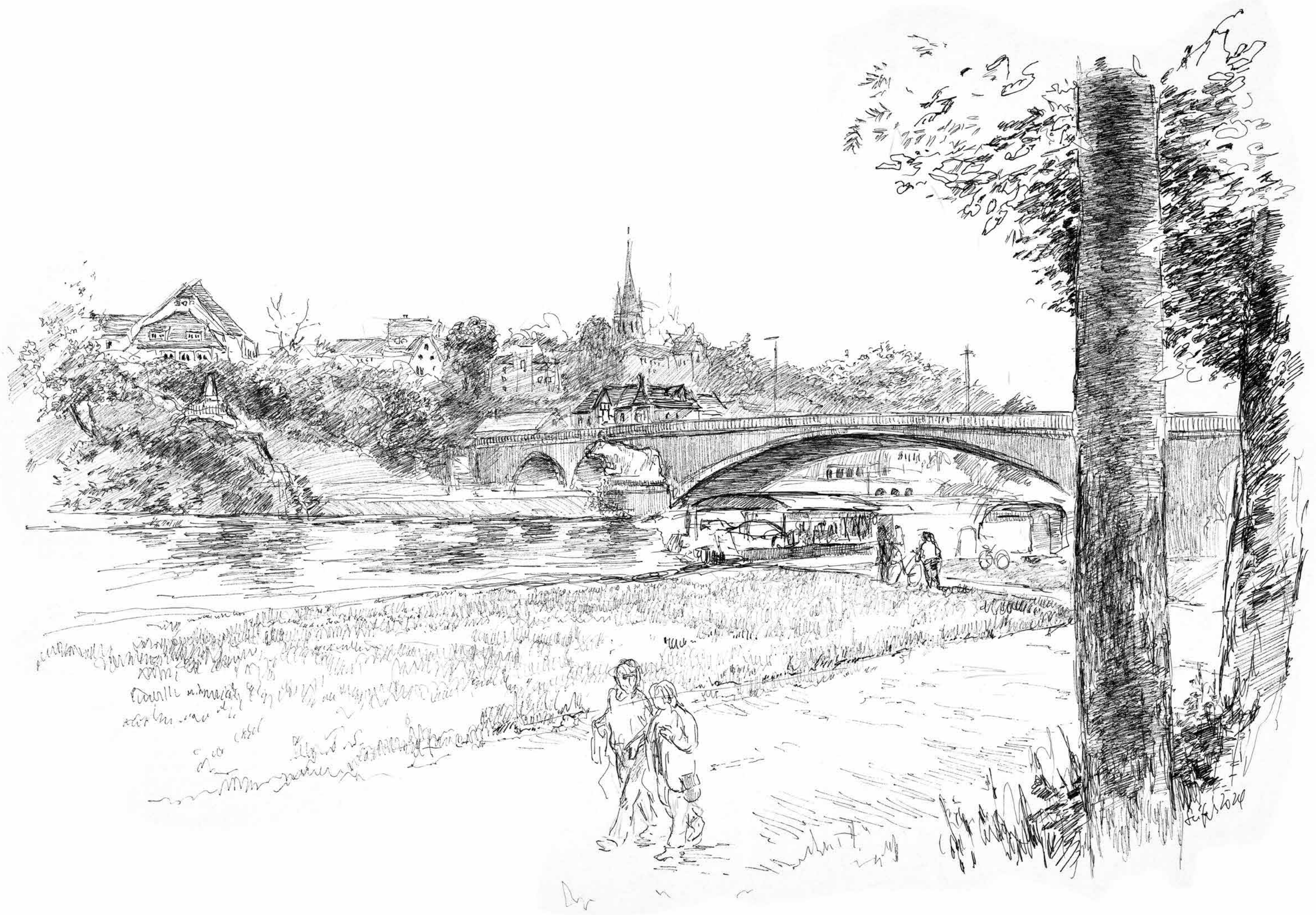
Saalepromenade • Tuschezeichnung • 2024 • 30 x 42 cm • Volker Seifert