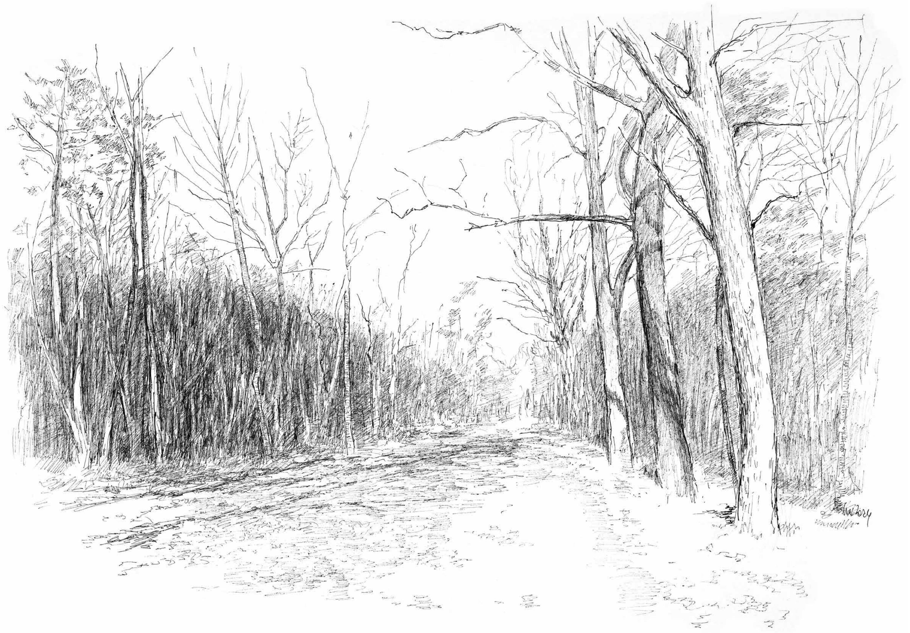
Kölkturnweg in der Dölauer Heide • Tuschezeichnung • 2024 • 30 x 42 cm • Volker Seifert